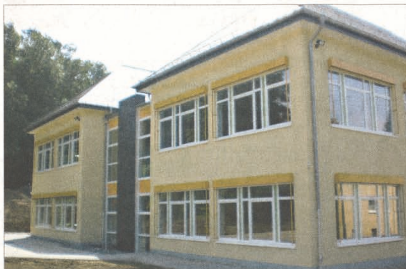
Der Neubau am Gymnasium Stift Keppel passt sich gut in das historische Gesamtbild ein. Nach rund einem Jahr Bauzeit wurde er jetzt fertiggestellt.